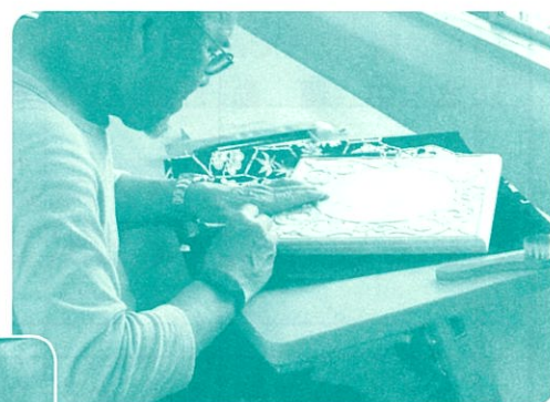
安楽地区 木彫り講座