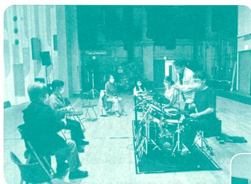
中央地区 初めてのドラム講座