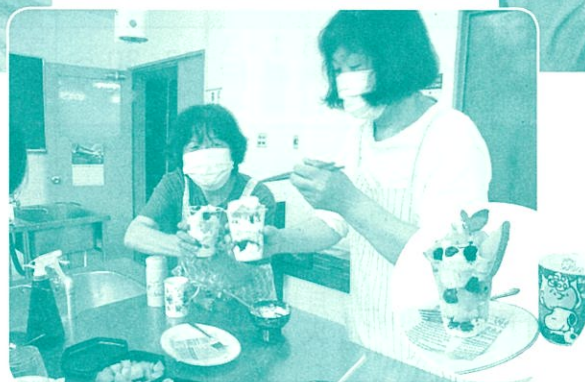
尾野見地区 おうちカフェを楽しもう講座