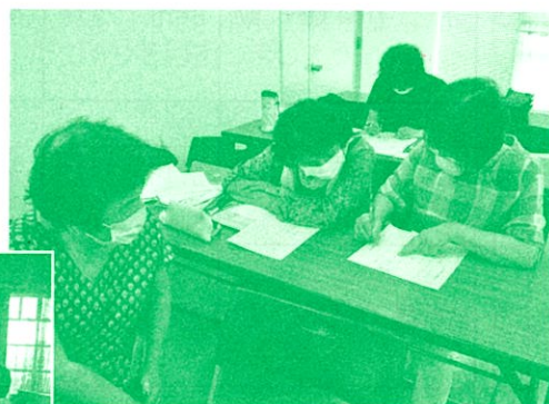
中央 ボールペン字講座