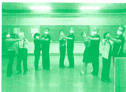
志布志地区 社交ダンス講座