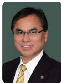
下平 晴行 志布志市長