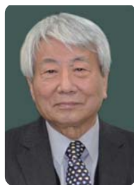
福留 強 NPO法人全国生涯学習 まちづくり協会理事長 聖徳大学名誉教授